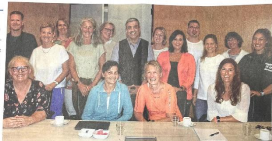
Arbeiten seit 2010 zusammen: die Aktiven vom Netzwerk für psychisch erkrankte Eltern, hier bei ihrem jüngsten Treffen am Dienstag im Lüdenscheider Kreishaus.